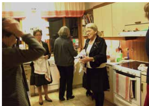
Diskningen efter firandet gick galant när vi alla hjälptes åt. Många fina minnen dröjer sig kvar efter dessa dagar.