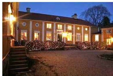
I Forsbacka Vårdshus mysiga miljö har många möten och fester ägt rum.

och Annica Berglund (bild ovan) om Kråknäsfyndet och stenåldersgravsättningarna i Torsåker.