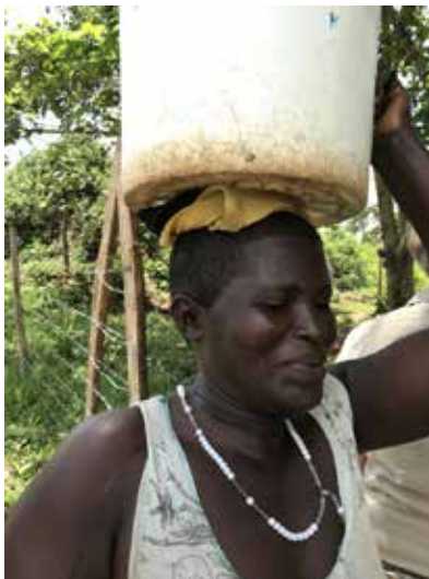
Det är ofta kvinnornas roll att förse hemmet med rent vatten och de får gå långa sträckor varje dag med kärnen på huvudet. Vår brunn gör skillnad!

I januari 2023 kunde Karin Håkansson på Rotary Doctors ge ett förslag på en brunn.