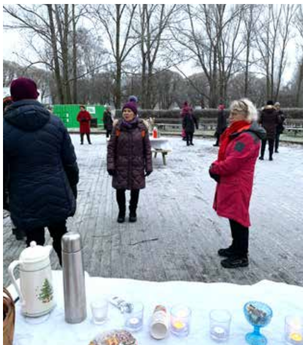
Glögg i december 2022 fick vi också i Stadsparken. Vantarna på och varm glögg i termos. Allt går!