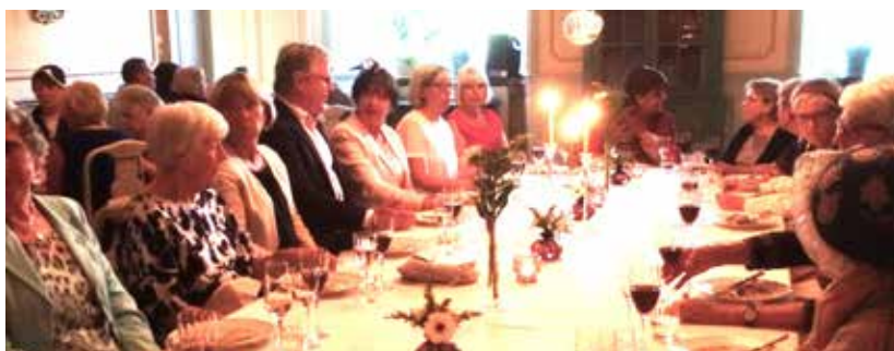
Vid det stora ovala bordet i mitten av matsalen fick många plats. Stämningen var hög och mat och dryck lät sig väl smaka.