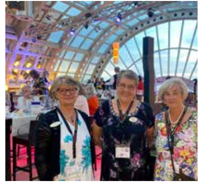
Sveriges/Sandvikens representanter på galamiddag på lyxiga KaDeWe i Berlin.

Vi var tre innerwheelare från Sverige. Alla tre från samma klubb - Sandviken IWC! Från Danmark kom det tre bussar med hela 100 deltagare. Hoppas vi blir fler från Sverige/Sandviken nästa rally, i september 2025 i Århus i Danmark.