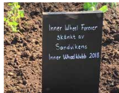
På årets utflykt 2024, åkte vi för att kolla rosen. Vi upptäckte då att den dött! Trädgårdsmästarna talade om att det ev. kommer en ny.

Tur i oturen kunde en av trädgårdsmästarna hjälpa till med ombyteskläder.