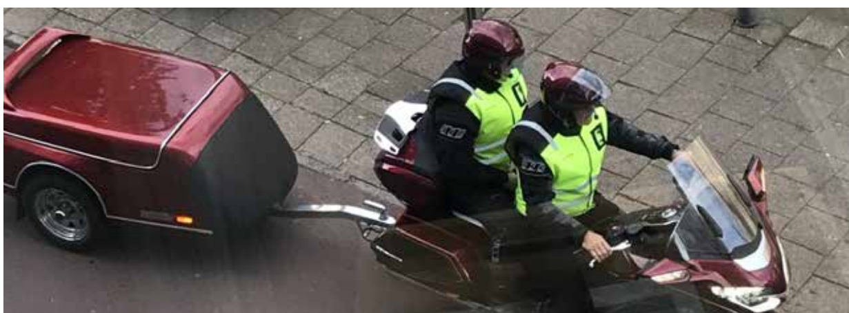
Vi tog motorcykeln från Sandviken till Rotterdam. Ekipaget väckte viss uppmärksamhet på Rallyt.

I IW är vi starka tillsammans och vill man så får man väninnor för livet!