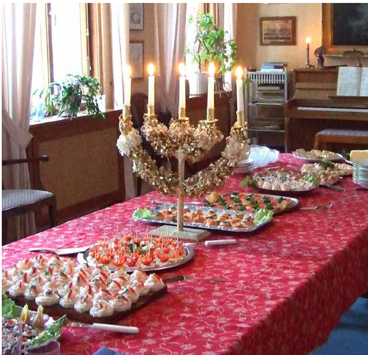
Så här tjustigt har det sett ut när vi medlemmar själva fixat snittarna till IW-dagen. Och gott var det också!