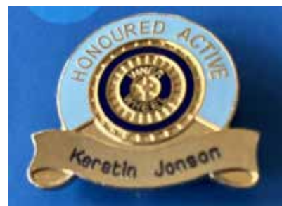
Brosch Aktiv Hedersmedlem / Honoured Active Badge.