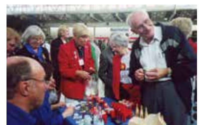
Stort intresse för tillverkningen av dalahästar på Convention i Stockholm 2000.

År 2000 var Sverige värd för International Inner Wheels Convention. Mötet hölls den 17–20 maj i Stockholm. Hela IW-Sverige var engagerat och Sandviken IWC hade hand om en grupp deltagare från England (UK). Distriktet ansvarade för en middag på Solliden. Arrangemanget blev mycket lyckat och många runt om i världen talar än i dag berömande om Convention i Stockholm.