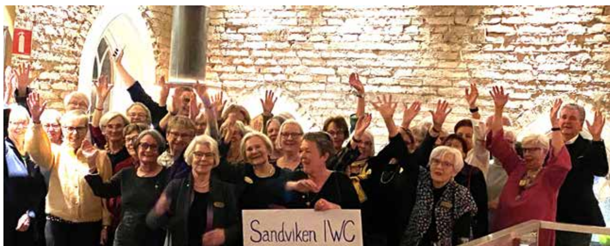
Stort kalas för Sandviken IWC 50 år på The Church i januari 2024.