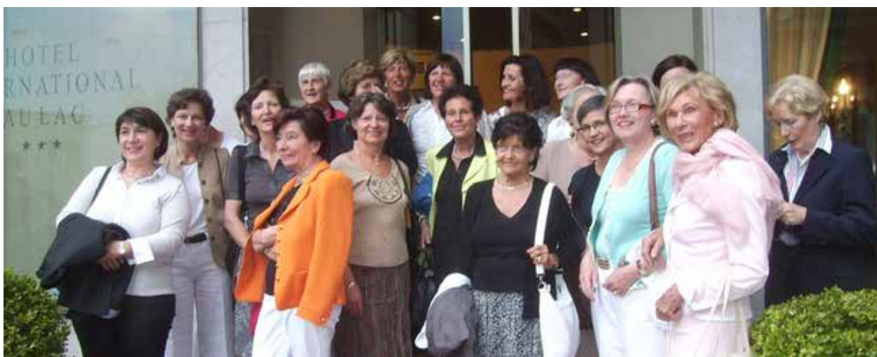
Reutlingen-Tübingen IWC gör årligen många resor och utflykter, en del med övernattningar. Här var vi i Lugano.