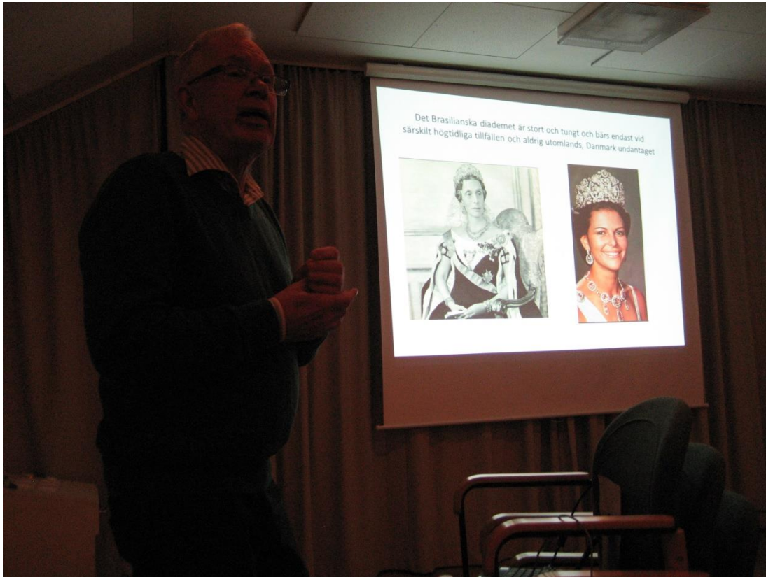
Drottning Louise och Drottning Silvia.