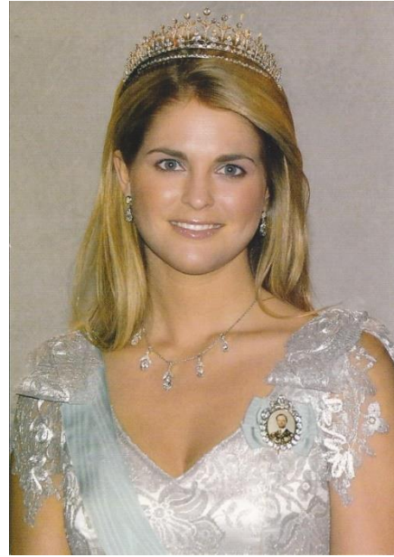
Prinsessa Madeleine med drottning Silvias diadem.