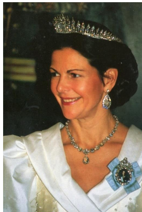
Drottning Silvia med drottning Viktorias diadem.