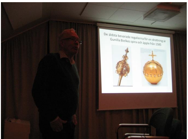
Spiran och Äpplet.