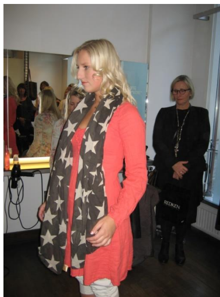
Exempel på vårens kreatioer.