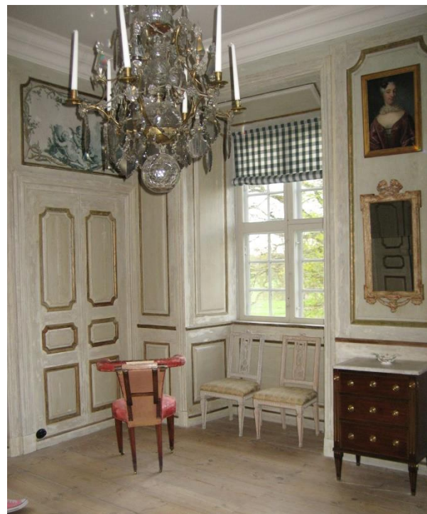
Plugghäst (den rosa stolen) där lästa man sina läxor.