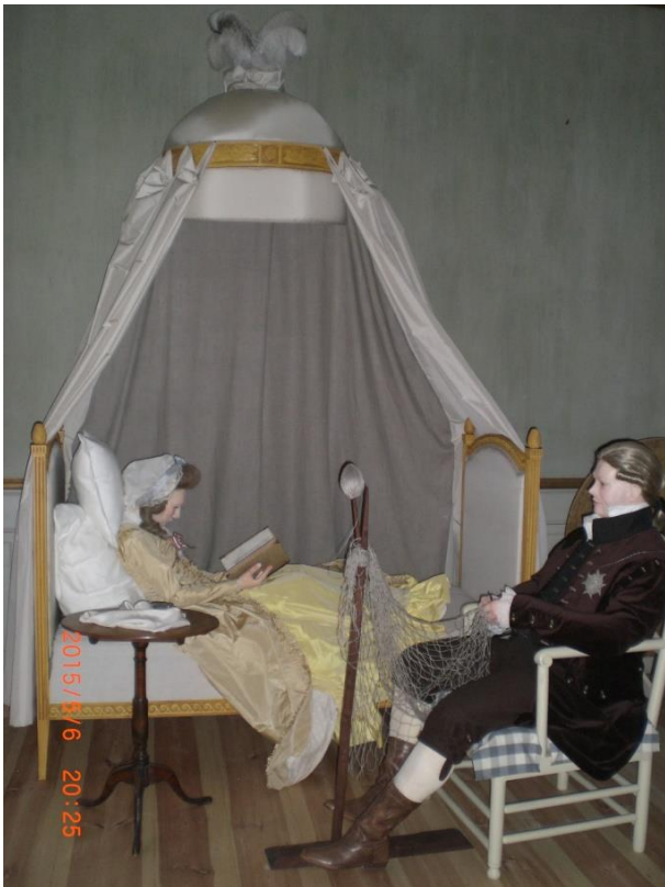
Himmelsäng. Grevparet Clas Julius Ekeblad och Britta Horn.