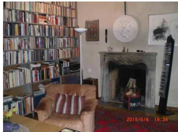
Nu är vi i biblioteket.