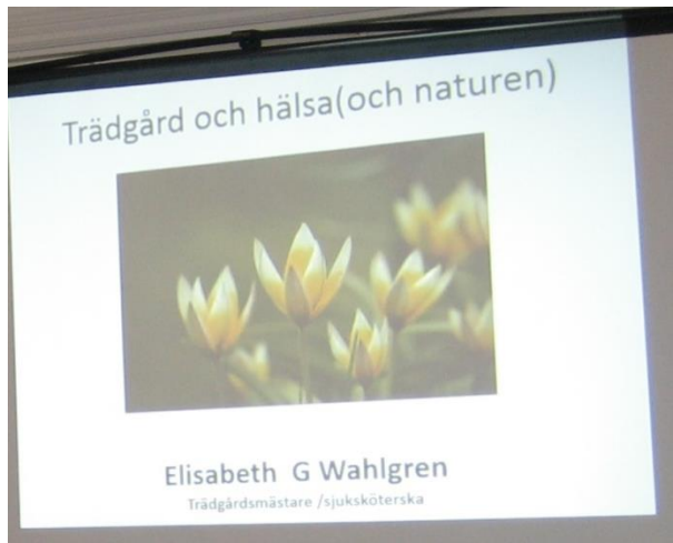
Trädgården och Hälsa (och naturen).