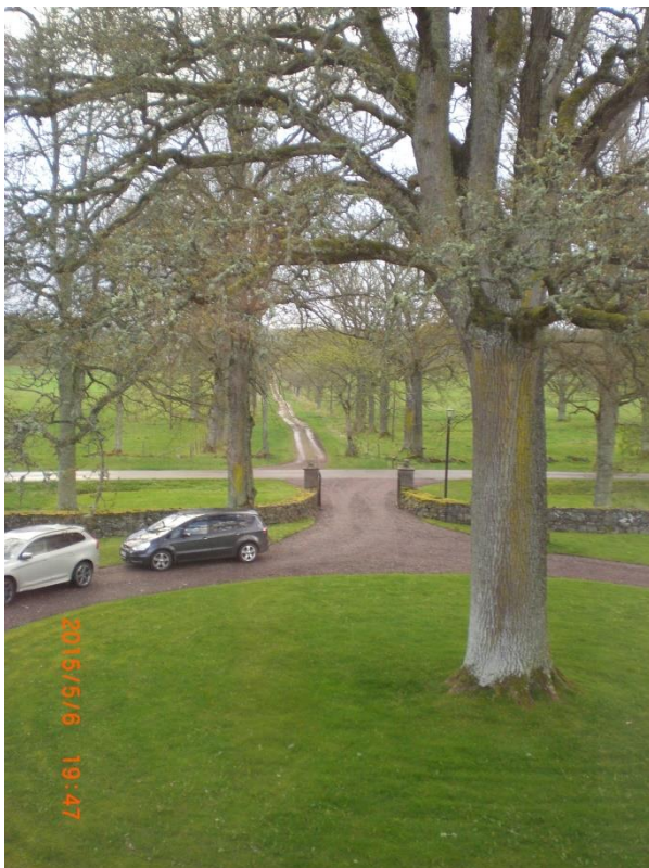
Gamla framfartsvägen (allén) till Stola herrgård.