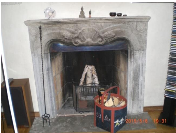
Öppen spis i biblioteket.