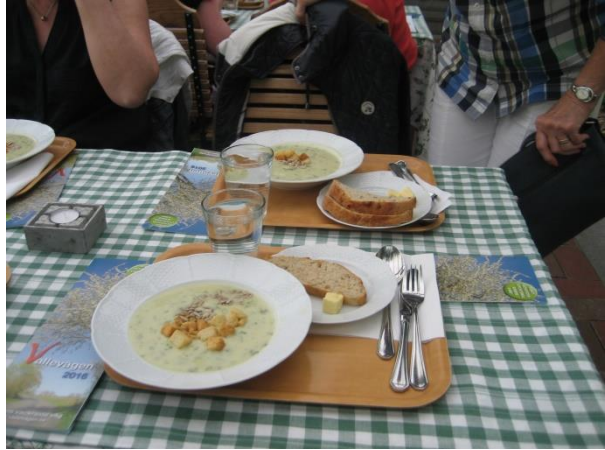
På HellekisTrädgårdscafé &Kök stod Ramslöksoppa, hembakat bröd, vatten/öl och kaffe med hembakad kaka på menyn.